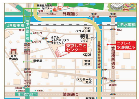
ニチレイ水道橋ビル 東京都千代田区神田三崎町3-3-23