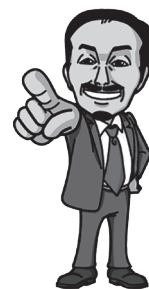
人事採用 コンサルタント

全国の高校・大学・自治体・等で「就職転職者・学生・教職員・保護者・人事向け」の講演セミナー・就業力育成カリキュラム作成・テキスト執筆などを行う。同時に多くの企業経営者・人事向けコンサルティングを行い「心を掴む採用」をプロデュースし実践している。